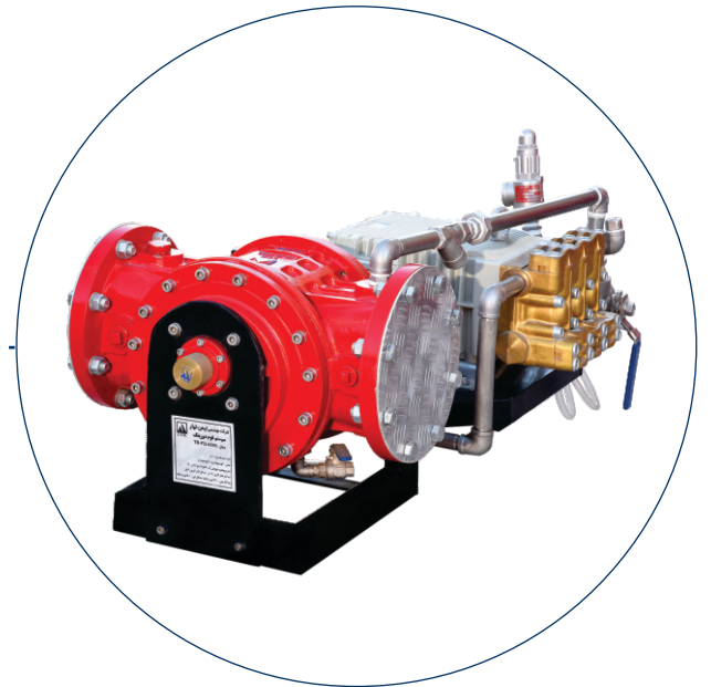
آزمون عملکرد سیستم فوم دوزینگ Foam dosing system operation test